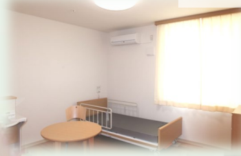
グループホーム 居室