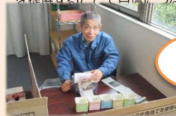
シュレッダー 作業

利用者様はいきいきと意欲的に作業に取り組んでいます。できることを提供することで自信につながり、やりがいとなっています。