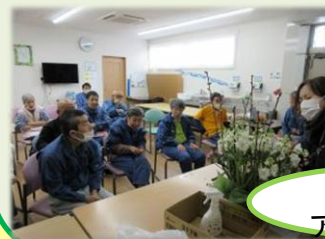
フラワー アレンジメント

紙芝居やフラワーアレンジメントなどのボランティアも積極的に受け入れ、季節に合ったイベントや創作活動を行っています。また、近くの駅舎掃除や公民館との苗植えなど地域の方とも交流も図っています。