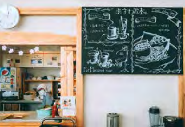
職員が描いたチョークアート

カケルフクシの思考とは ”いろいろな切り口と福祉を掛け合わせて 新たな企画や支援に活かしていく。” これがカケルフクシの定義となります。 切り口は日常の至る所にあふれていて、 職員の趣味や特技から支援方法につな がったり、「カフェ」や「アート」をテーマに してみたら大きな企画につながったりと、 福祉には無限大の可能性があります。 足羽福祉会ではこのような創造性を福 祉の魅力ととらえ、研修に取り入れる等、 職員全員がこの思考をもって仕事に取り 組んでいただくよう、積極的に啓発を行っ ています。