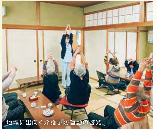
地域に出向く介護予防運動の啓発

今回の取材テーマがカケルフクシということで、私は地域交流を通じて「福祉の仕事＝支援ではない」ということを皆さんに知ってほしいです。地域支援の取り組みが再開できていない現状ではありますが、地域と関わることは職員にとっても地域にとっても福祉への視野を広げきっかけになると思います。これからも、そういった福祉マインドを後輩に伝えていきたいです。