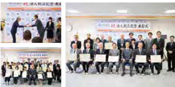
法人創立記念表彰式の様子。法人に尽力し続けていただいている方、様々な形で貢献して頂いている方に表彰状が送られました。

例年、法人創立記念日である10月1日に開催されていきましたが、今年は1日が土曜日となったため、10月3日に開催いたしました。当日の表彰式において、地域の方への感謝状授与、永年勤続表彰、職員特別功績表彰を行いました。まだ予定を許さない新型コロナウイルスの感染対策として、今年度も午前部の部と午後部の部に分け、笑顔が多い和やかな雰囲気で行われました。