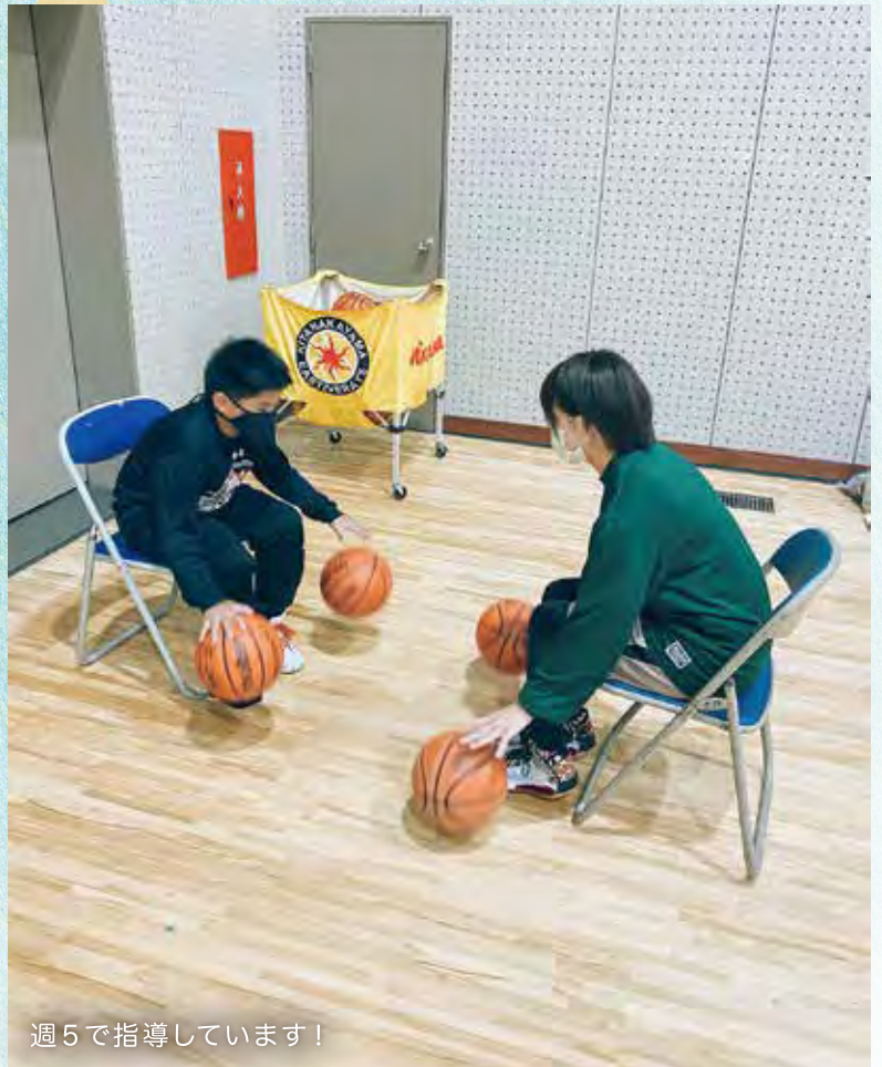
週5で指導しています!

今の段階から運動神経を刺激することで、中学生や高校生になったときにいろいろなスポーツの動きに対して楽