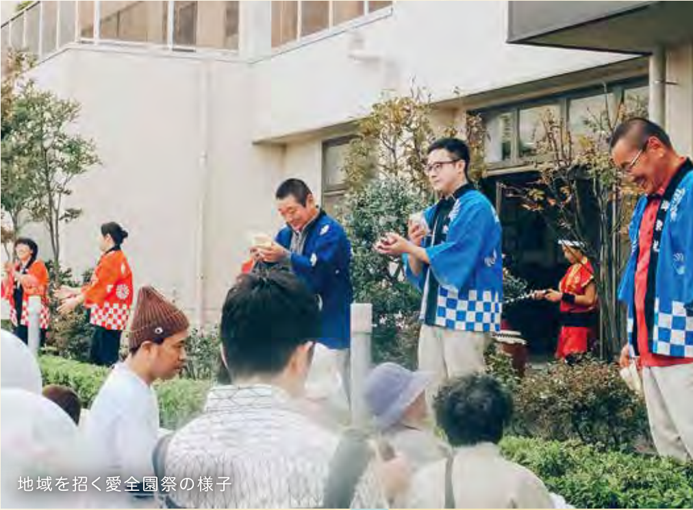
地域を招く愛全園祭の様子