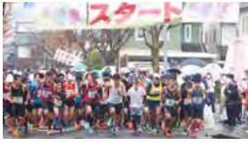
足羽川ふれあいマラソンのスタート地点。多くの方がそれぞれの目標を持って懸命に走ります。あいにくの天候となりましたが、ボランティアの方含め地域の多くの方に支えて頂き、足羽川ふれあいマラソンが実行出来ました。

また、大人数イベントとしながら感染を抑え込むという非常に難しい開催となりましたが、地域の方々をはじめボランティアの方々などの多大なご協力やご支援を賜り、改めて御礼申し上げます。