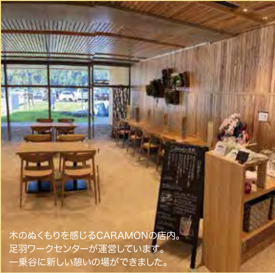
木のぬくもりを感じるCARAMONの店内。 足羽ワークセンターが運営しています。 一乗谷に新しい憩いの場ができました。

ここでは食べられない特別なメニューも多数ございますので、是非一度足をお運びいただき、CARAMONでくつろぎながら、かつての朝倉氏の栄華に思いを馳せてみてはいかがでしょうか。