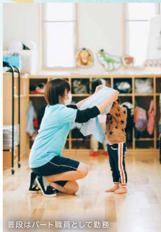
普段はパート職員として勤務

4〜5歳児になるとフラフープやボールを使った遊びにもルールを設けたり、遊び方を応用してみたりするなど、年齢にあわせて楽しく遊べるように工夫していきたいです。加えて、他の先生の発想でいいアイデアだな、と思うものを参考にさせていただき、自分のアイデアを組み合わせた上で、より子どもたちが楽しめるような企画を実施していきたいです。