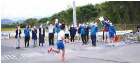
学生を応援する足羽福祉会の職員。応援する側も熱量はランナーと変わりません。コロナ禍によって希薄になった地域との関わりが出来る事を大いに喜んでいます。

全力疾走でたすきをつないでいく中学生の姿に、少なくない刺激をいただき、よりよい地域づくりへ貢献してまいります。