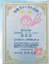
社員ファースト企業