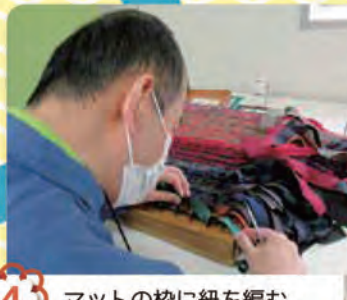
4 マットの枠に紐を編む