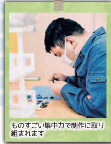
ものすごい集中力で制作に取り組まれます