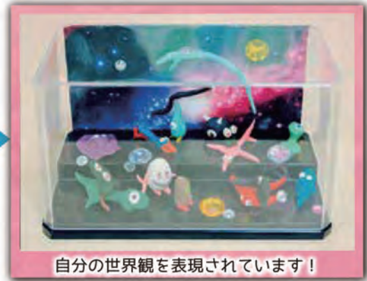
自分の世界観を表現されています！