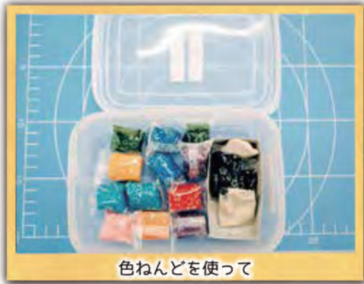
色ねんどを使って