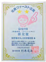
社員ファースト企業