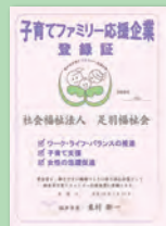
子育てファミリー応援企業