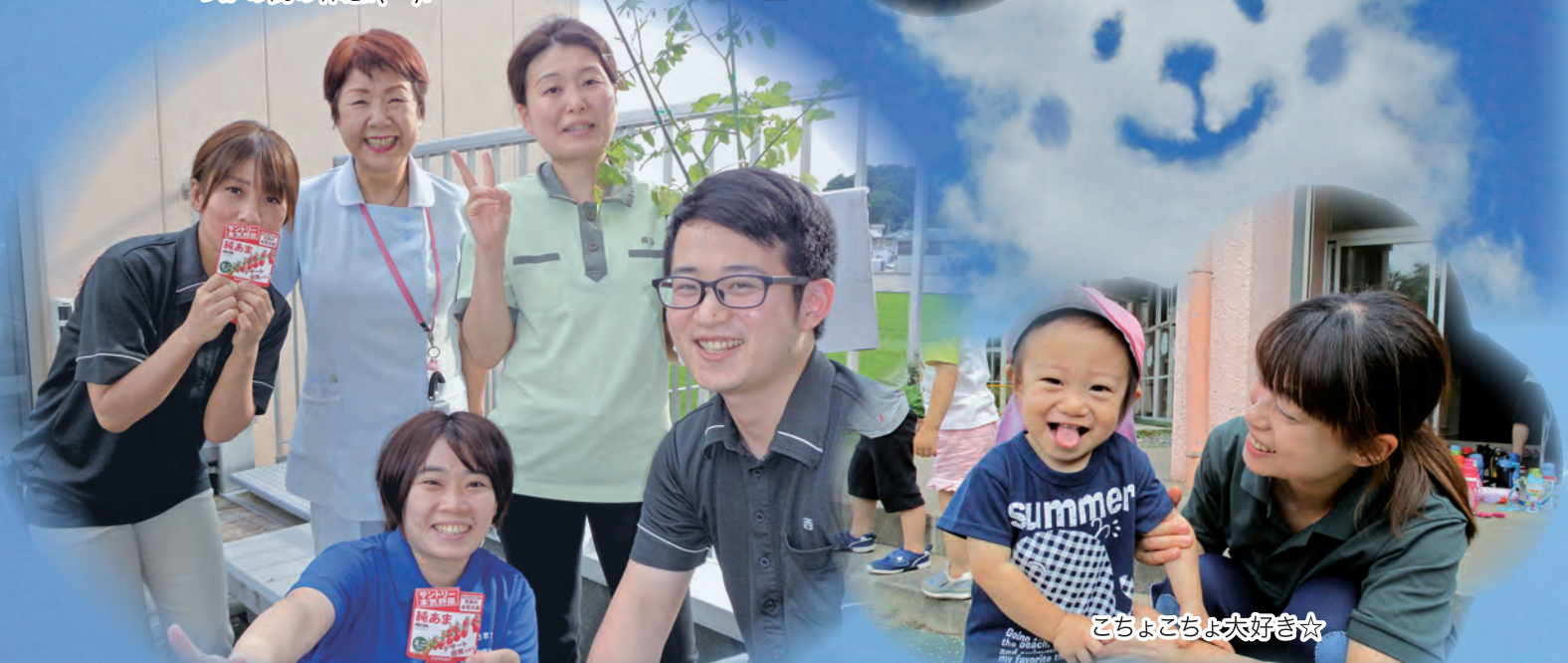
こちょこちょ大好き☆