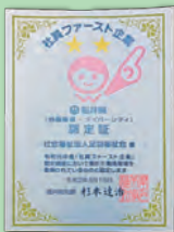
社員ファースト企業