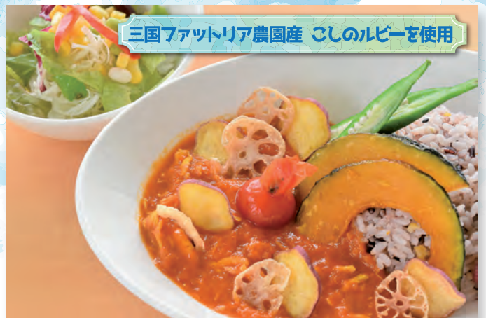
三国ファットリア農園産 こしのルビーを使用 こしのルビーをベースにしたチキンと野菜のトマトカレー 800円（税込み）