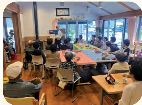
H30.11.22 美山カフェ陶芸教室