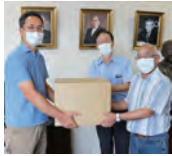
(職員へマスクをご提供)