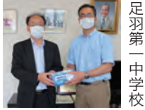
足羽第一中学校 酒生公民館