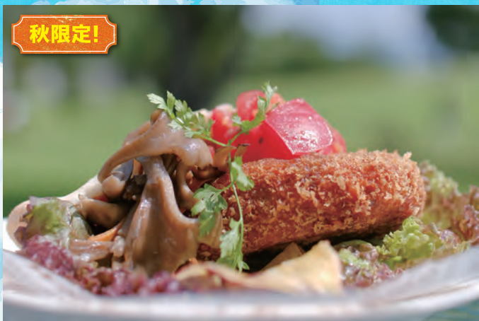
2020秋のピタパン（「昇竜舞茸」「カボチャコロッケ」「こしのルビー」） 350円（税込み）