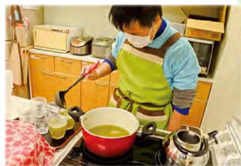
真剣に、ゼリーを作っています