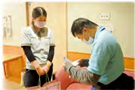
報告カードを使って職員に報告するSさん