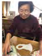
(職員へマスクをご提供)