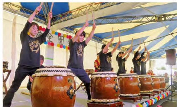
職員も負けていません