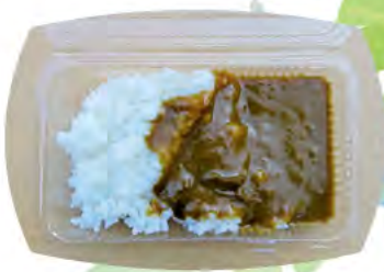
地域の方と職員で協力して作りました