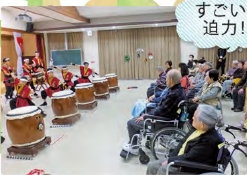
利用者の方も聴き入っています