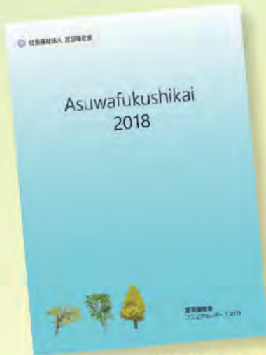
(デザインは一部変更になる場合があります)