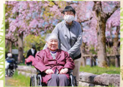
ポカポカ陽気のお花見