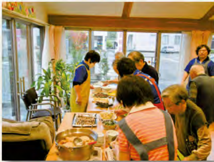
おはぎバイキング