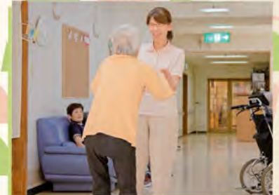
その調子でゆっくりと