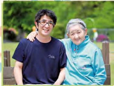
かわいい息子のよう