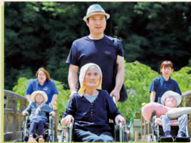
朝倉氏遺跡へお出かけ