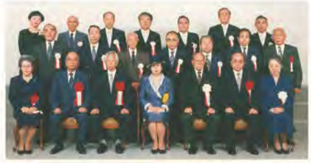
創立25周年記念(平成4年6月9日) 三笠宮妃殿下(前列中央)、高木総裁(前列右端)