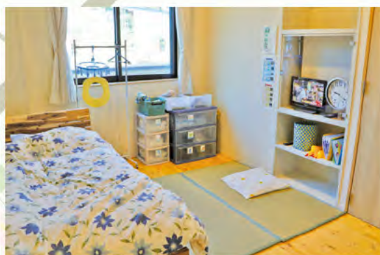
あたらしいお部屋！