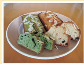
お手製のパウンドケーキ