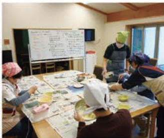
当日の計画や役割も みなさんで決めます