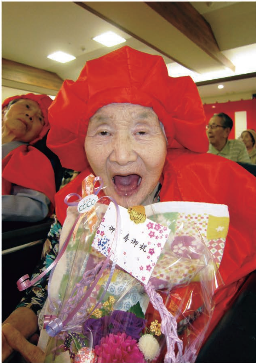
敬老会での素敵な一枚も見事当選写真に！

愛全園では平成25年度より「愛全園写真展示総選挙」を行っています。この取り組みは年末年始の行事として、利用者の方、来園される