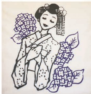
手ぬぐいに描いたデザイン画

絵を描くことが得意なAさんは、イラストレーターにも興味をもっています。現在の粘土細工の活動に併せてデザイン関係の活動も織り交ぜながら、Aさんの自立に向けた取り組みを行っています。と考えています。