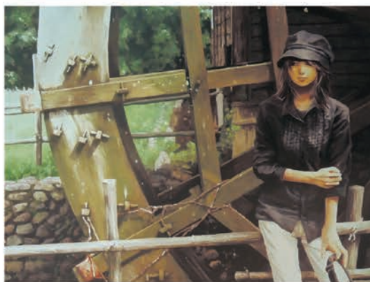
パソコンで描いた作品