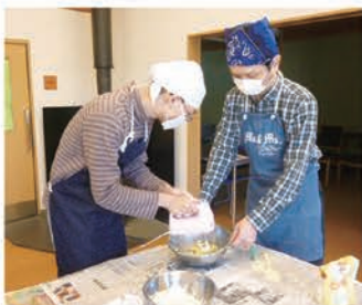
みんなで協力して…