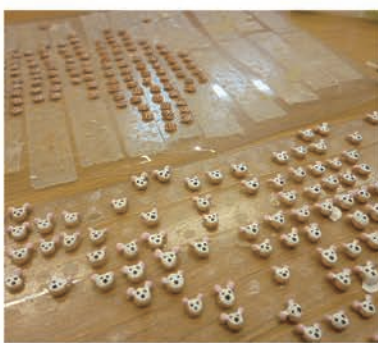
小さいパーツを組み合わせて仕上げます

仕上がった作品はパーツ一つひとつが細かく、細部まで丁寧に仕上がっており、職員も驚くほどです。クオリティについては、Aさんに自信をもっていたためにも作品