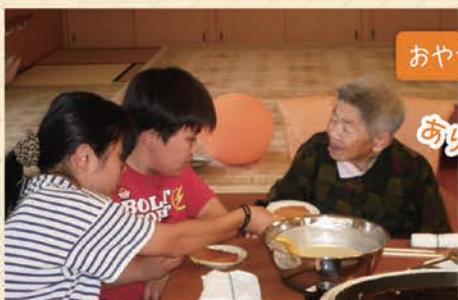
おやつ作り交流会