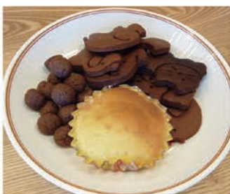
クッキーとマドレーヌのできあがり