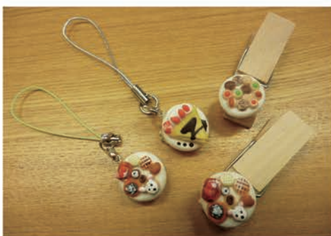
ストラップ(左)とクリップ(右)

家に閉じこもることが多かったAさんですが、こうしたアピールポイントを含めた活動を通して、週5日の利用で毎日パステルに通うことができています。