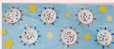
ばくのわたしの「花火」を製作

左写真は併設の特別養護老人ホーム「愛全園」の畑におじゃまさせていただき、野菜の収穫を行った様子です。初めての体験にお子さんたちは目を輝かせていました。