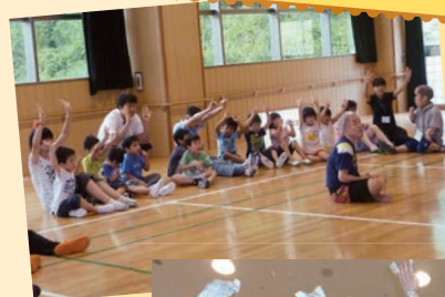
ミュージックケア交流