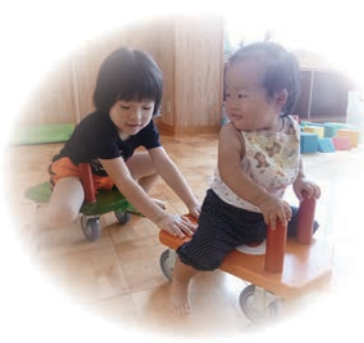
年長組のお姉ちゃんに遊んでもらって