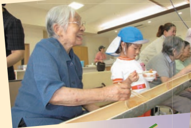
流しそうめん交流