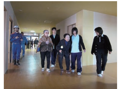
あせらず、かつ安全に避難を・・・

の利用者の方を誘導するだけでも想像以上に時間がかかり、避難の難しさを実感することができました。 100名以上の方を避難誘導することによって、ただの時間がかかるのか、どう動けばよいかの課題がみえてきました。その課題をふまえて、施設全体の避難訓練に取り組んでいきたいと思えます。