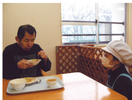
利用者の方と田端栄養士

※ダシは本がとおと昆布、煮干しからとっており、最後は煮干しの粉が鍋の底に溜まっています。