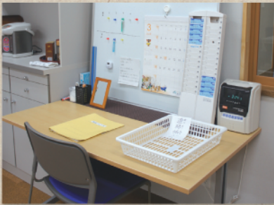
出勤したら、タイムカードを押して、鏡で身だしなみをチェックします。