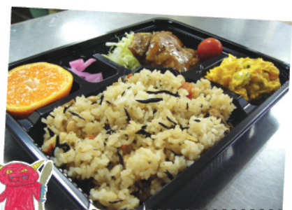
節分に豆を混ぜた鬼っこご飯♪ 栄養士オリジナルメニュー

現在の羽生の郷のお弁当は彩りがよく、目で見ても楽しめるお弁当になっています。しかし、そこに行きつくまでは平坦な道のりではありませんでした。