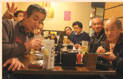
ちょっとお酒をたしなみながら

3月の終わりに「ケアホームさつき」で生活している14名の方が夕食外出に出かけました。向かった先は食べ放題！…若干年齢層が高めだったせいか、最初に食べ過ぎてしまい、早くにギブアップしてしまいました。トホホ。