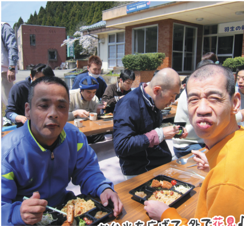
お弁当を広げて、外で花見♪

温かいものを温かいうちに提供し、家庭的な味でお腹も心も満たしてほしい。そんな思いを込めて厨房では今日も料理を作っています。今回は、ひと手間を惜しまず、料理の幅を広げる厨房の様子を紹介します。