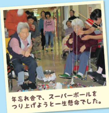
年忘れ会で、スーパーボールをつり上げようとして一生懸命でした。