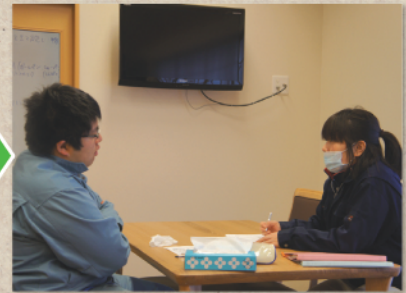
相談は随時、個別に時間を取りながら、ていねいに聴き取ります。