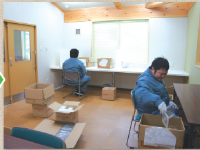
午前中は、作業を中心にすすめています。