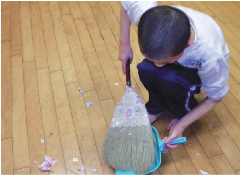
ほうきとちりとりを上手に使います

今では自ら職員の肩を叩いたり、視覚情報を指さしたりして「○○ください」と要求されるようになってきました。1枚では足りないときは、再度要求しに來られ