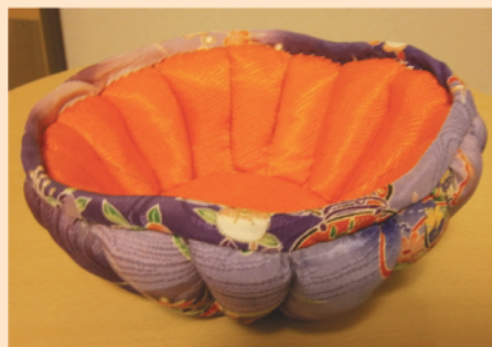
お菓子入れのかごです。