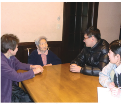
ケアマネージャーと職員が訪問しお話を伺います