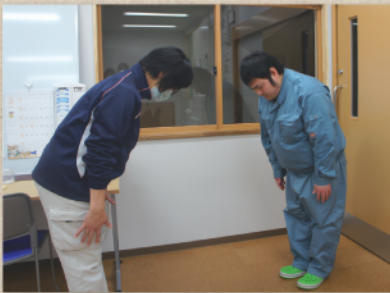
1日を通して作業をするとどうしても疲れてしまいます。午後はスキルアップのための支援を中心に活動します。 (左: あいさつの練習、中央: 調理訓練を通してコミュニケーション能力のアップ: 右: 文房具の使い方の練習)