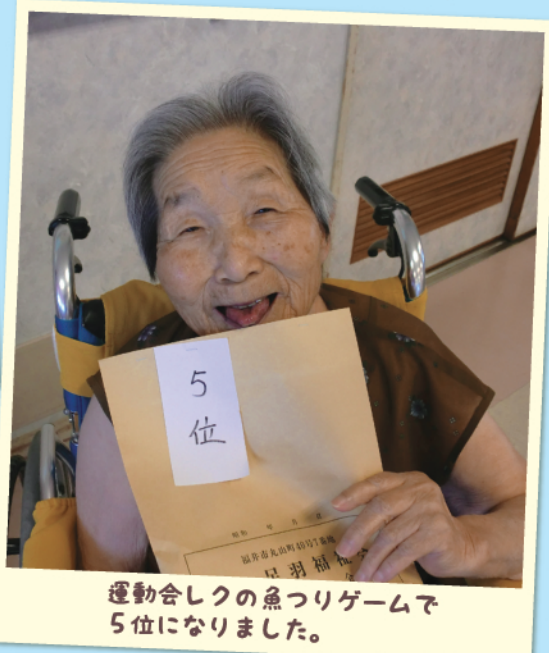
運動会しくの魚つりゲームで5位になりました。