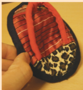
わらじのポーチです。

丁寧な作りの作品からAさんの優しさが伝わってきます。次はどんな作品を作られるのでしょうか。待ち遠しいです。