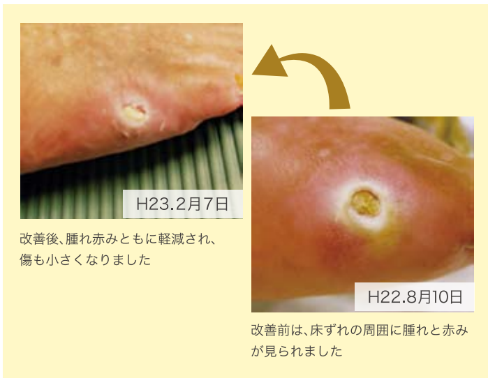
改善後、腫れ赤みともに軽減され、 傷も小さくなりました

今後もその方の心に寄り 添いながら支援することで、 利用者の皆さんが安らかに 過ごせることを望みます。