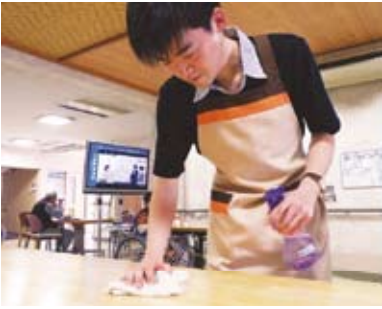
ピカピカに磨き上げます！