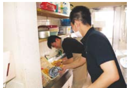
愛全園の職員からも頼りにされています。

しかし、日々実習を重ねることで「わからないことは職員に聞く」「自ら考えをめぐらせ、仕事に工夫をする」などの積極性が垣間見られるようになりました。この努力が認められ、長年の夢であった就職の道が開けたのです。その夢が実現した今、就職したことでの心境の変化があったのか、また、改めて今後の夢について率直に語っていただきました。