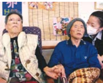
Aさんの奥さんと一緒に