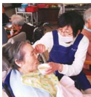
直接かかわることで気づきも多い

このようにご家族の意見をうかがったり、利用者の方の様子を見させていただいたりしていると、栄養がどうのよりもまず、楽しく、おいしく食べていただくことが大切だということに、だんだん気づかされていきました。