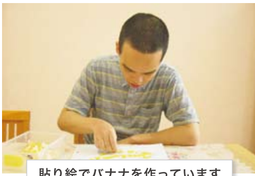
貼り絵でバナナを作っています