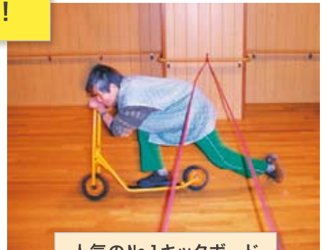
人気のNo.1キックボード

経過を振り返りながら、意見交換を重ねていくと、利用者の方にとって、ラジオ体操は「難しい」「楽しくない」から参加しないのでは?という気づきがありました。そして「楽しい活動」があれば参加してもらえるのではないかと考え遊具を使う時間・音楽の時間など多彩な活動メニューを取り入れていきました。