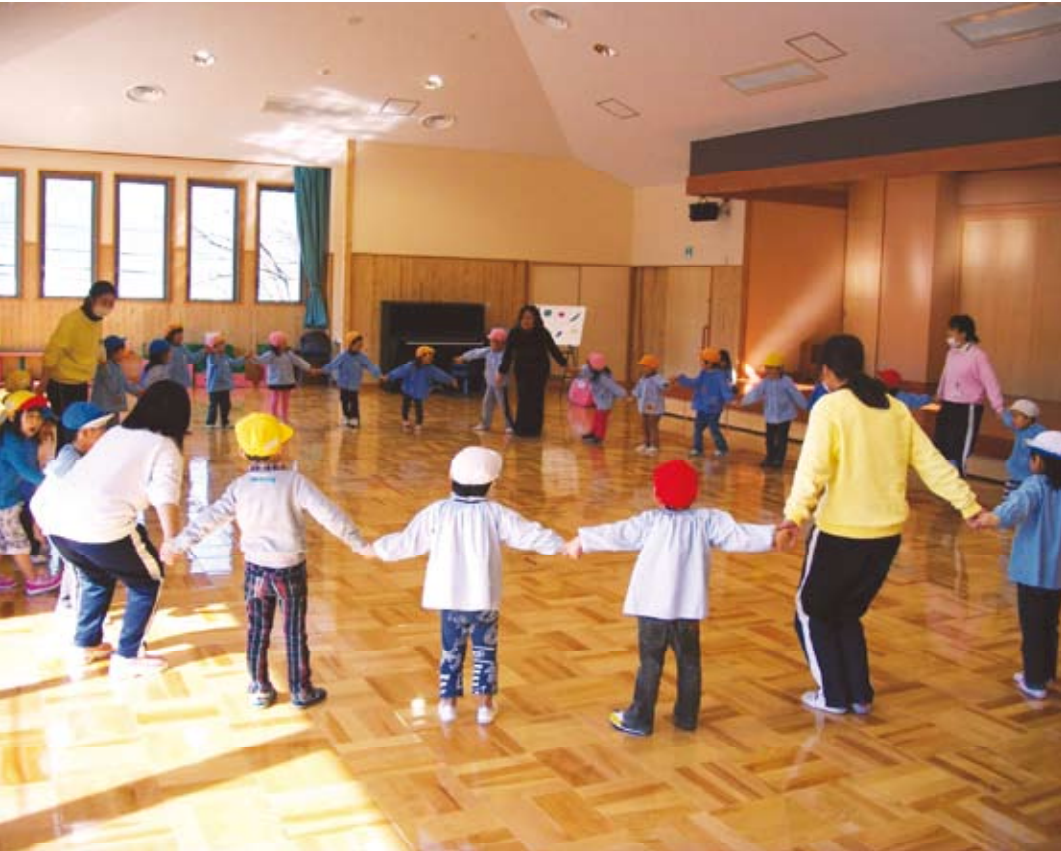
『ふれあいホール』で集団遊びを楽しむ子どもたち

足羽東保育園の子どもたちは勿論、地域の子どももお年寄りの方々も、保育園で楽しく過ごしていたきたいという願いから、保育園の増築を行いました。平成22年11月に完成した新センターの外観は「光、希望、明るい未来」をイメージした虹がモチーフになっており、完成後、さまざまな取り組みが行われています。