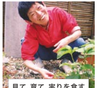
見て、育て、実りを食す 家庭菜園♥(女子寮)

そして、他の寮でおもしろい余暇を見かけると、自分たちの寮に工夫をしながら積極的に導入していきます。また、お互いの寮が成功したこと・工夫したことなどを報告し合う場を定期的に設け、振り返りを続けていきます。