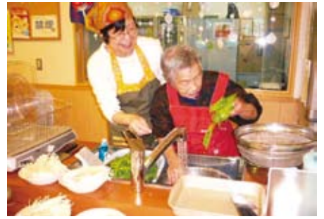
すきやきの準備中