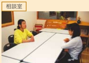
「保護者の方が、職員にいつでも相談できるようにしていきたい」