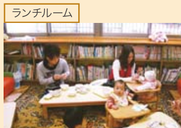
「入園前の子を招いて試食会がしたいな」