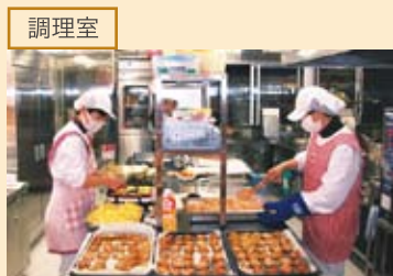
「保護者対象に、手作りおやつ教室を開きたい」