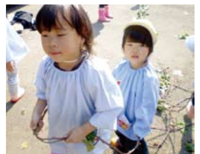
姉妹で電車ごっこ

母 母親は子どもがおなかの中にいる時からつながっていて、切っても切れない関係ですが、父親は出産してから父親になるので、子育てをしなかったらただの同居人です。子どもと接しないと、子どもは父親を見て泣き、