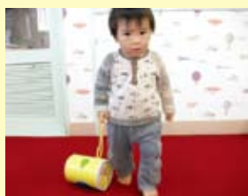
<ミルク缶の缶転がし> コロコロ、一緒にお散歩