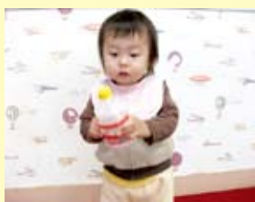
<携帯ミルク缶のマラカス> フリフリ♪どんな音？

オリジナル 手作りおもちゃ編 手作りのおもちゃには温もりと楽しさがいっぱい。遊び込むことで、赤ちゃんの心と体はすくすく発達していきます。身近な素材で簡単に作れます。