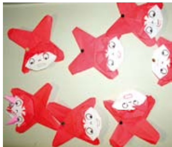
いろいろな表情があるよ♪

折り紙クラブの出展作品といえば、折りづる、花かごとといったものが多かったですが、ときには、アイディアを凝らして話題のキャラクターにも挑戦しています。