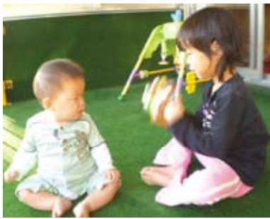
泣いている弟を鈴であやす、お姉ちゃん

父 育児は楽しくてストレスにならないですね。子どもが昨日と違う言葉や動きをすると、毎日成長しているんだとうれしく感じます。子どもと同じ目線で話を聞くと、成長を感じます。大変なのは3人の子どもをお風呂に入れるときですかね。