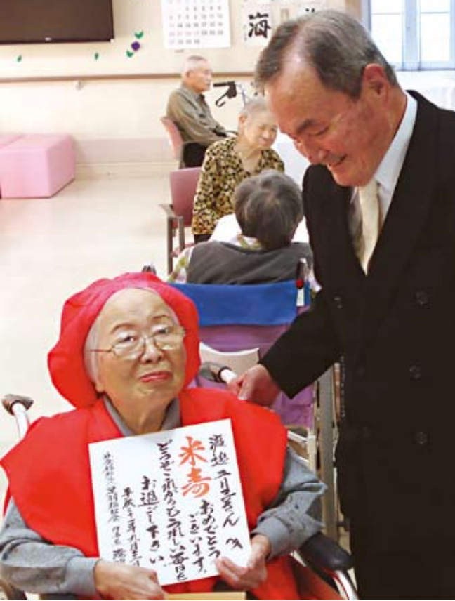
米寿を心からお祝い致します

インフルエンザの流行が一 番の心配事でした。多くの 方々がご一緒している私た ちの施設では、その感染予 防に万全を尽くすことが肝 要となります。皆さん方と ご家族の方々、いつもお世 話になっている多くのボラ ンティアの皆さん、地域の 皆さん、そして関係者各位、