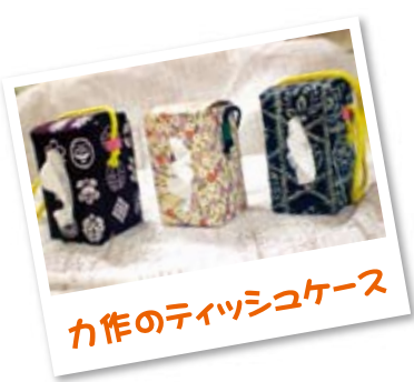
力作のティッシュケース

顔を協力しながら、作業されたり風船バレーをしたりと、午後のひとときを自由に過ごされています。顔なじみの人と一緒に活動することで「久しぶりに会うけど元気やったかの」と会話もはずんでいました。