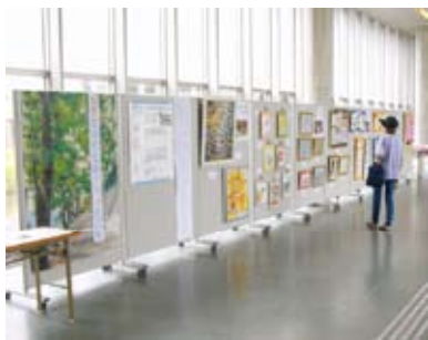
福井県立図書館ロビーにて(平成21年8月開催)

利用者の方の素晴らしい作品を、もつと社会の人々に見てもらいたいという職員の思いが、さらに、大きな一歩を踏み出し、社会資源の活用へと取り組みの輪が広がっていきました。