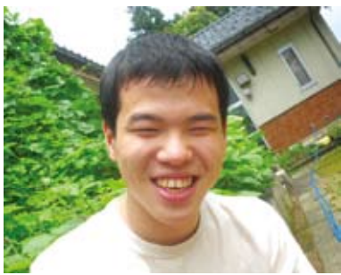
仕事を終えて、満面の笑み

これからも利用者の皆様、ご家族の皆様に「足羽福祉会でよかった」と思っていただけることが総合福祉施設の役割です。