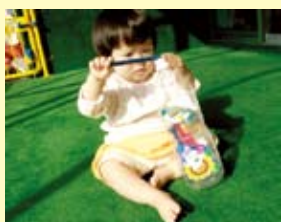
<ペットボトルの棒落とし> 穴を見て、なかなか入らない…