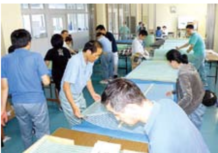
型があると分かりやすい☆

利用者の方には数多くの工程をしていただくのではなく、一つの工程に集中していただくことでスムーズに作業を進めていただけるようになりました。半年が過ぎた現在では、利用者の方、職員も整えられた環境で、協力して取り組んでいます。