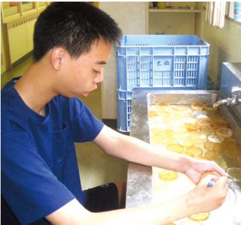
時間が過ぎることを忘れるほど作業に集中するHさん