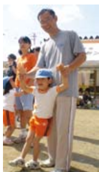
運動会で 親子ふれあい

妻が職場復帰をするに当たり、それが自然な流れでした。2人の子どもだから2人で育てたいという考えがお互いにありました。